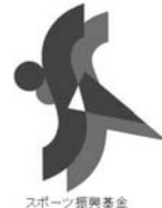
スポーツ振興基金

この大会は、日本スポーツ振興センターのスポーツ振興基金の助成を受けて開催しています。 http://www.nash.go.jp