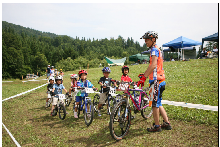
平成20年度の全国小中学生大会 講習会

平成20年度には、福岡県、熊本県、愛媛県、広島県、岡山県、兵庫県、滋賀県、愛知県、長野県、静岡県、千葉県、神奈川県、宮城県、岩手県といった会場で実施されております。子供達の交流を作り、地区に於ける人間関係の充実など、さまざまな面で効果があると思います。皆様の参画で、ぜひ大きな流れになるように御協力を御願いたします。